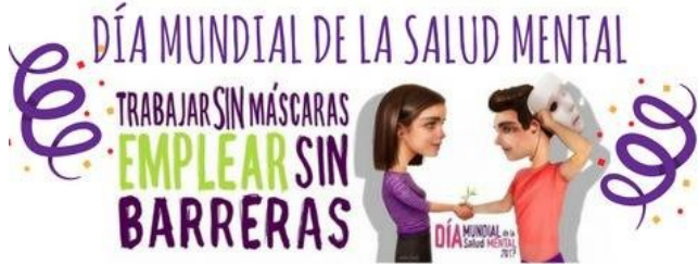
Ilustración Día Mundial Salud Mental 2017 del movimiento asociativo agrupado en Confederación SALUD MENTAL ESPAÑA.