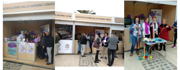
6 de Marzo: Escuela de Salud MurciaSalud

Del 2 al 4 de Marzo en el Puerto de Cartagena: La I Feria de la Universidad Católica de Murcia de Voluntariado