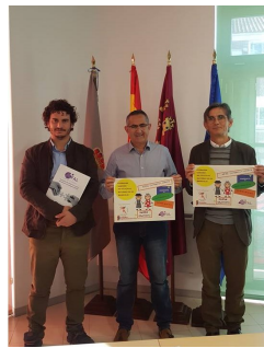
Taller de Memoria en Torre Pacheco.

Ya se ha firmado el convenio con el ayuntamiento de La Unión para realizar una edición del curso de cuidados básicos de personas mayores en el domicilio.