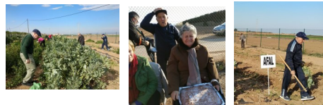
22 de marzo: Recibimos a la primavera en los huertos de AFAL